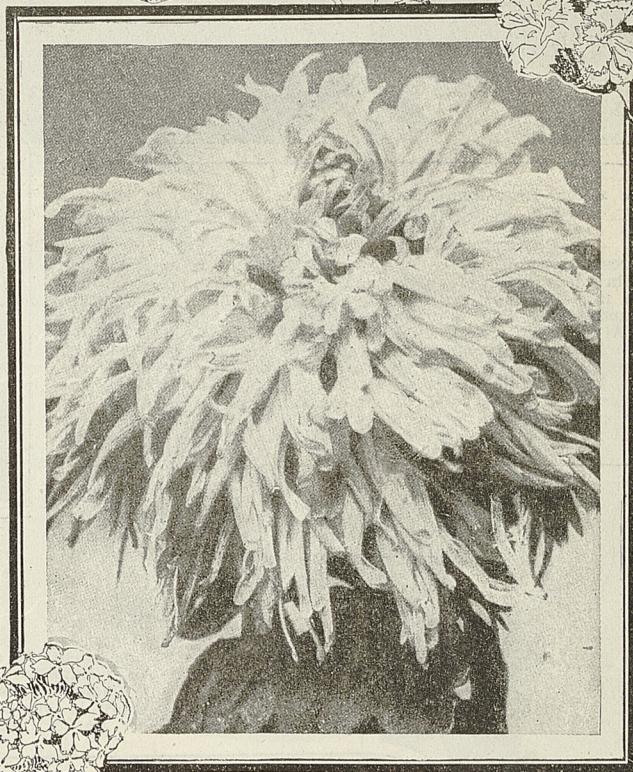
Chrysanthemo "Biche", uno de los magníficos ejemplares presentados en la Exposición de Flores, inaugurada ayer

Aquel señor había visitado las Gotas de Leche los Asilos Maternales, La Cruz Roja, los dispensarios de la Asociación de Señoras contra la Tuberculosis, etc., etc. y fácilmente se comprende que estas visitas a los centros filantrópicos, donde nuestras damas despliegan todo el celo