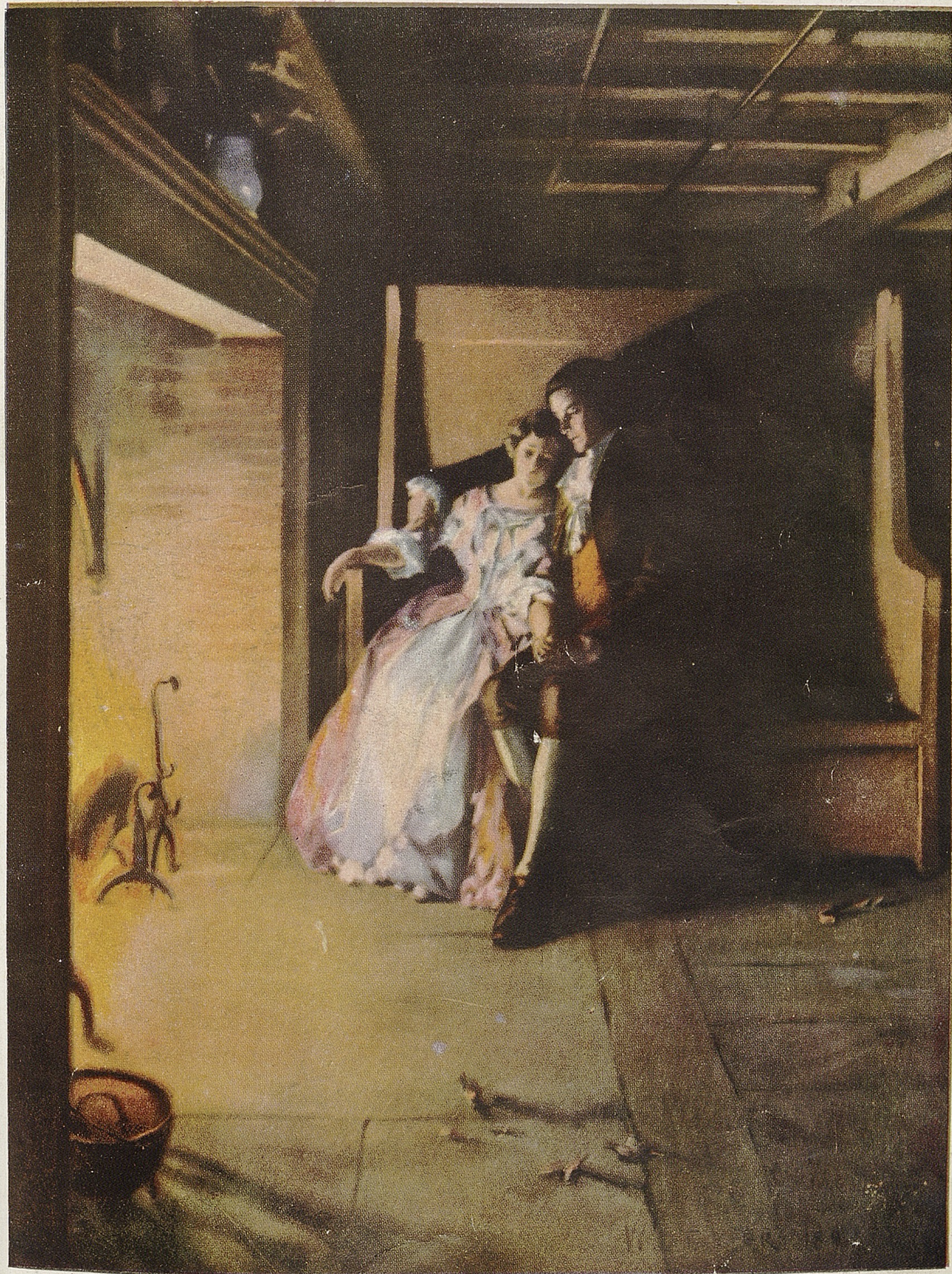
Junto al hogar.