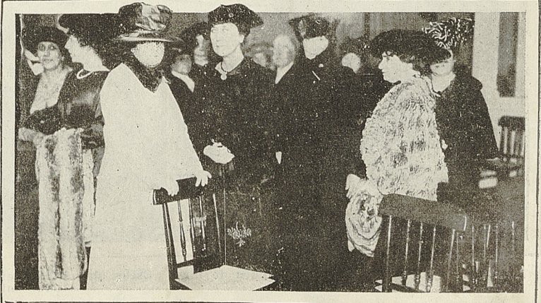
Distinguidos concurrentes a la conferencia dada en el Círculo de Lectura por el Marqués de Dosfuentes.

—El domingo 15 del presente, ante numero.