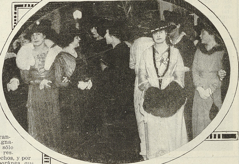
Concurrentes a la conferencia dada en el Club de Señoras.

montándose hasta aquellos tiempos caballerescos en que la altiva y valiente castellana, heroína de los dramas de capa y espada, comienza a convertirse en la romántica doncella que entre las rejas escucha al trovador; luego la época medioeval de la "tapada", de las dueñas; en seguida la mujer moderna que, a imitación de la francesa abre sus salones a magnates y literatos, dominando sólo en apariencia, mientras se restringen más y más sus derechos, y por último, la mujer contemporánea que aspira a unirse al concierto del progreso y que aboga por su libertad. El conferencista fué aplaudido repetidas veces durante el curso de su interesantísima alocución, en la que vibró muchas veces su entusiasmo por la patria española, que es también un poco patria nuestra.