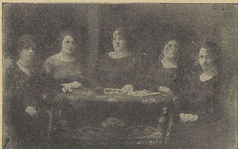
MESA DIRECTIVA DEL PARTIDO CÍVICO FEMENINO

Esta justa y simpática cruzada pro emancipación social y cultural de la mujer, repercutirá con eco generoso no sólo en el ele-