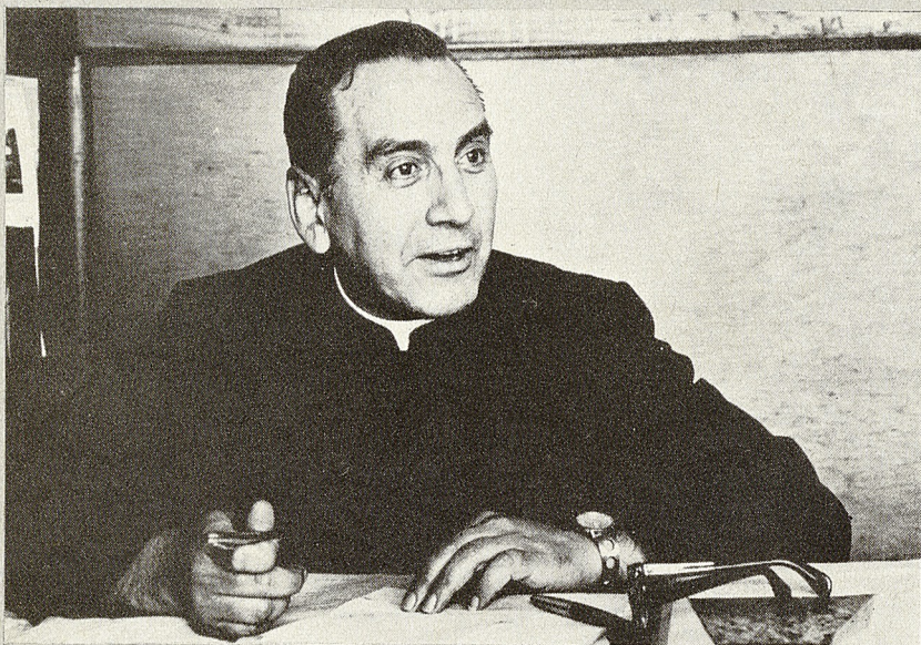
Padre Renato Poblete, sacerdote jesuita.