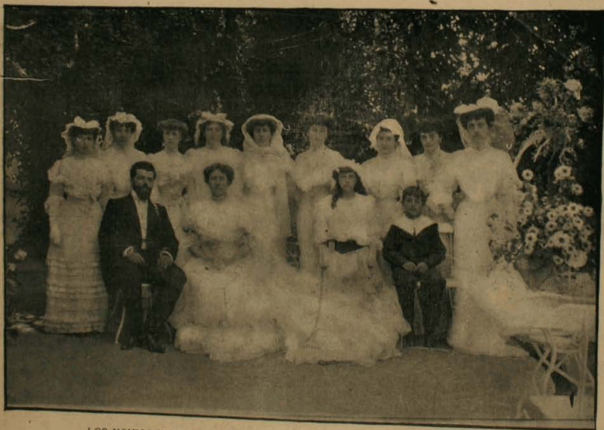
LOS NOVIOS Y PARTE DE LA CONCURRENCIA EN EL PARQUE DE LA QUINTA

to y animacion. A las 6 de la tarde el tren especial que habia llevado a los concurrentes de la capital, emprendió su viaje de regreso.