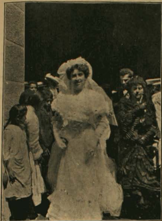
LA DESPOSADA A SU REGRESO DE LA CEREMONIA

Estos últimos teams practicarán hoy en la mañana en su cancha del Club Hípico.