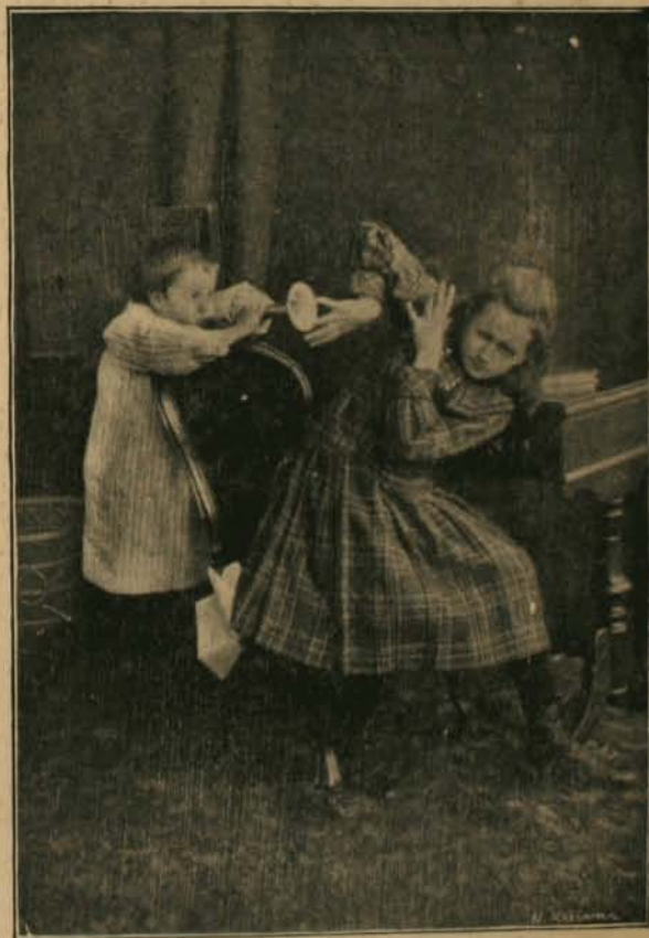
F. de N. Krziwan p. Z. Z.