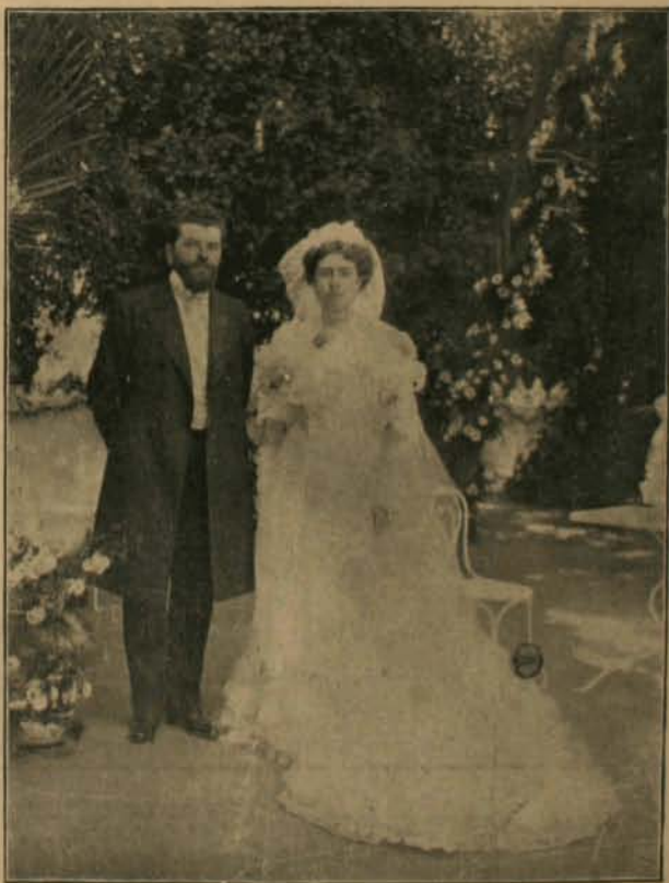
LOS NOVIOS EN EL PARQUE DE LA QUINTA BALMACEA