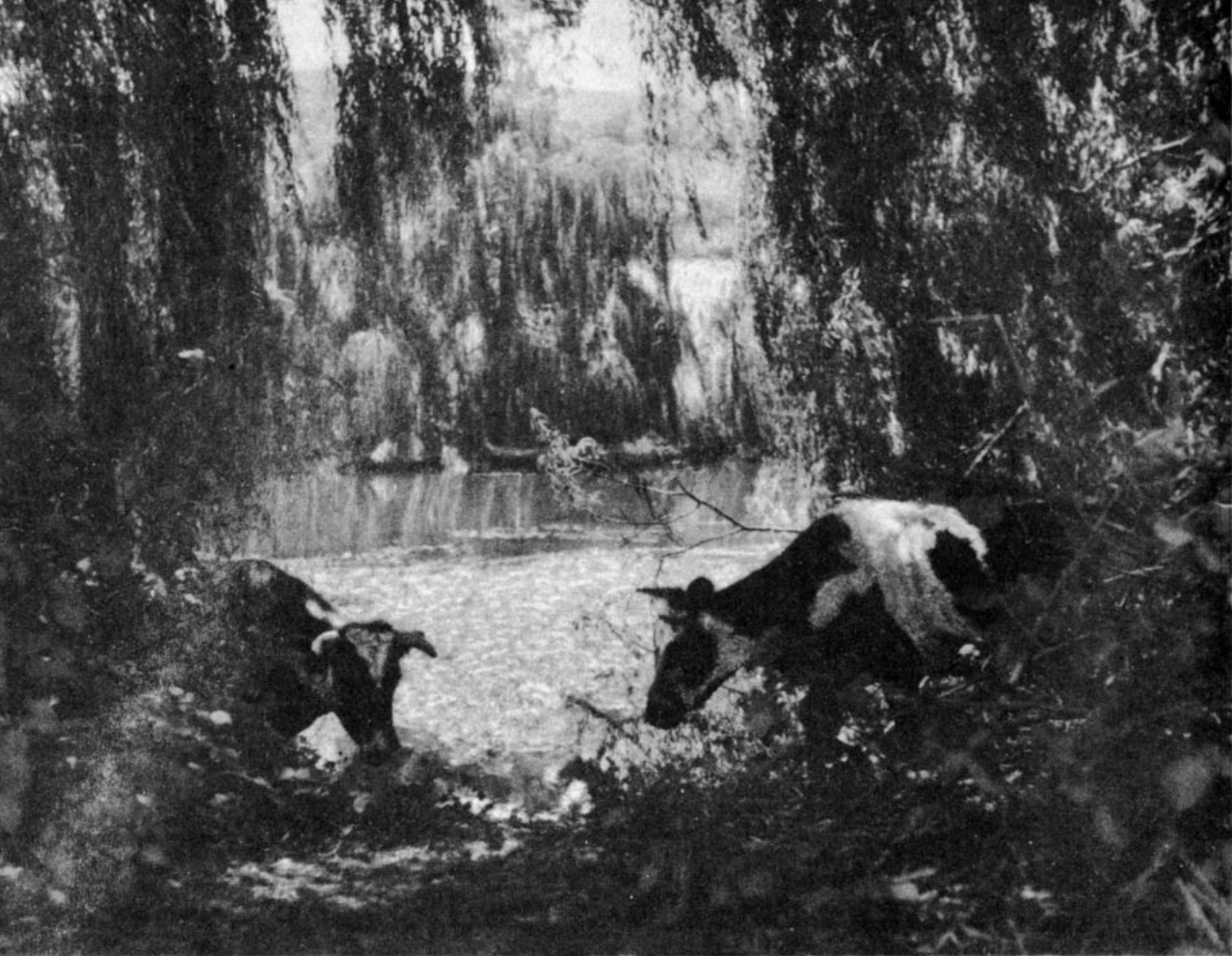
En la selvática región sureña

—Es hija del “Trueno”, la porranca ésta, pues, patrón. Del mismo padre del “Clavel”. Tuavía no le he puesto freno pa que no se resabee, pero es más atenta que un melico pa obedecer con el puro jaquimón.