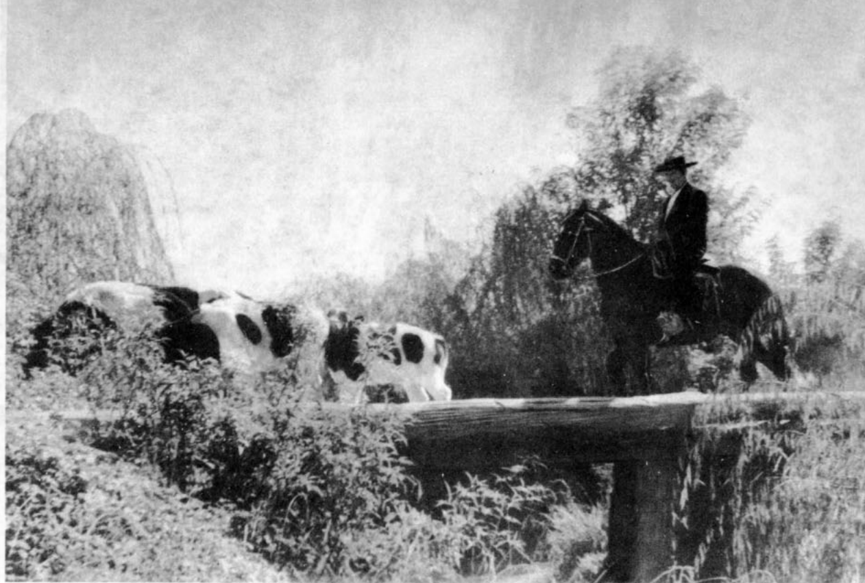
Hombre de campo atravesando un puente de madera

caballo, miércoles... ¡Y la "Espuma" es mucha yegua también, es una yeguaza, patrón, por las setenta mil vírgenes de nuestro padre Adán!