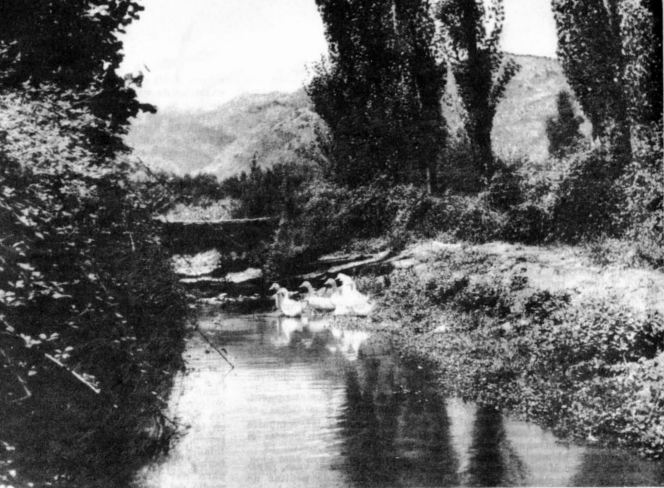
Típico paisaje chileno (Región Central)