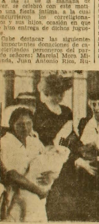
Grupo de asistentes a la fiesta de Navidad en la San Borja.