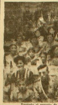
Durante el reparto de juguetes en el Grupo Móvil de la Prefectura del Tránsito