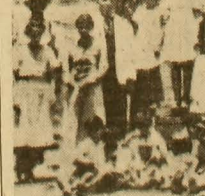
Parte de los niños que fueron festejados por la Compañía de Cervecerías Unidas.