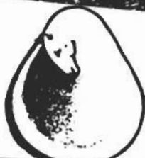
LA GOTA PURA Revista de Poesía