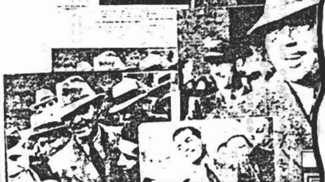
Hizo como que se dolía cuando consiguiera un libro.