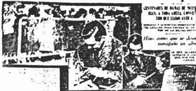
CENTENARES DE DAMAS DE NUESTRO PAÍS, A TODA COSTA, COMIENZAN A LLORAR AL VER A CLARK GABLE EN EL ESCENARIO DEL GRAN TEATRO DE LA NACIÓN.

"Las chilenas son sensacionalmente encantadoras" dijo Clark Gable