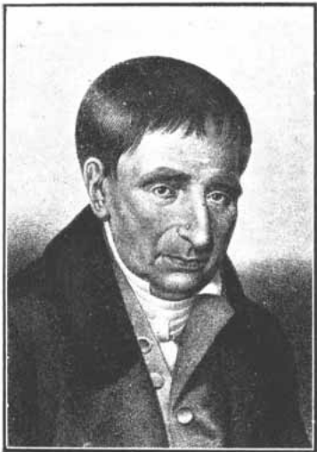
MANUEL DE SALAS