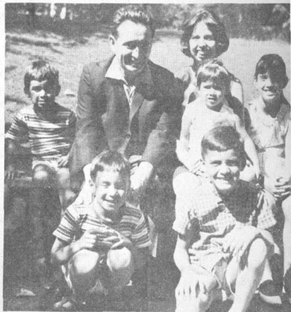
"Ya no cuento lo que me contó mi "ñaña".

—En general mi obra ha sido recibida fríamente, tanto por gente de derecha como de izquierda. Después de "Los Altísimos", los comunistas no me pueden ver. Y los de derecha... bueno, pienso que no están muy al tanto de la literatura moderna.