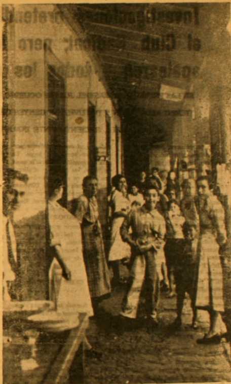
Una de las tantas viviendas destinadas a obreros. — Los estudios indican que a ello se deba la alta cifra de mortalidad que tiene nuestro país

Estas medidas surgirán como el resultante de la necesidad de que tal artículo baje de precio, cominando inmediatamente con la aplicación de los precios que rigen para los artículos de primera necesidad, con el objeto de llegar inmediatamente a la de este artículo.