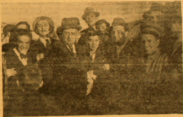
La foto muestra el aspecto risueño del piloto del avión que se accidentó el Domingo último en forma espectacular. — El hombre está satisfecho: a expensas de su propia vida ha logrado salir del anonimato