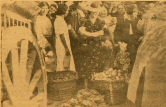
El Alcalde de Santiago en las Ferias Libres. Esto era al principio, ahora ya no se preocupa

pequeño derecho a cada comerciante para poder instalar vehículos en las ferias libres y destinar esa entrada al pago de los Inspectores para que se terminara con esta molesta situación. Mientras no se haga este gasto los habitantes continuarán siendo explotados; mientras los señores ediles, colocados en la Municipalidad por voluntad del pueblo, no se comprometen de que han sido colocados allí para que defiendan los intereses de los electores, seguirá la explotación y los especuladores podrán actuar como mejor les convenga.